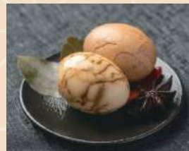
茶叶蛋 Tè, uovo 1.00 €