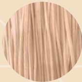
Spaghetti 2 细的