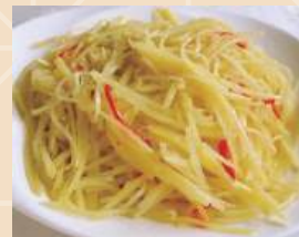
凉拌土豆丝 Strisce di patate 3.50 €