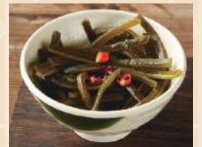
海带丝 Strisce di alga,olio di peperoncino,olio di sesamo 3.50 €